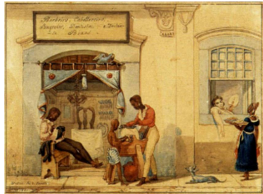
JEAN BAPTISTE DEBRET: Loja de barbeiros, 1821.